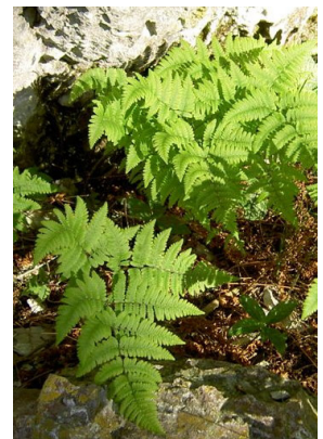
Woodsiaceae Gymnocarpium robertianum Ruprechtsfarn