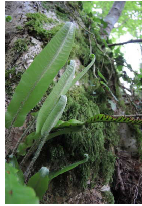
Aspleniaceae Phyllitis scolopendrium Hirschzunge