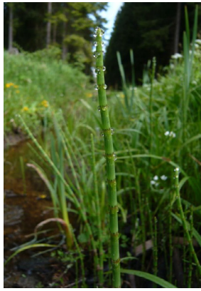
Equisetaceae Equisetum fluviatile Schlamm-Schachtelhalm