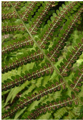
Dryopteridaceae Dryopteris filix-mas Wurmfarne