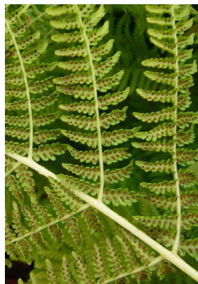
Woodsiaceae Athyrium filix-femina Frauenfarn