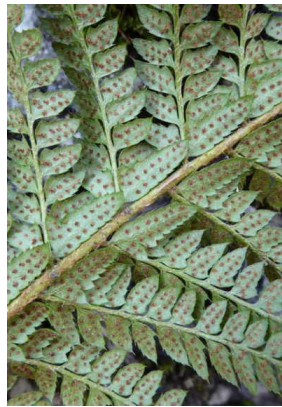
Dryopteridaceae Polystichum aculeatum Gelappter Schildfarn