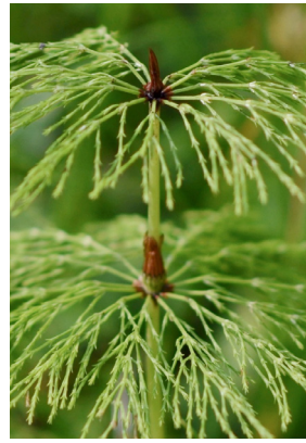
Equisetaceae Equisetum sylvaticum Wald-Schachtelhalm