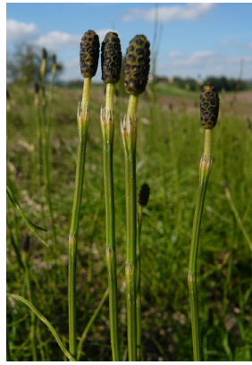
Equisetaceae Equisetum palustre Sumpfschachtelhalm