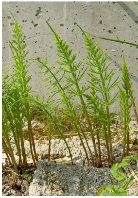
Equisetaceae Equisetum arvense Ackerschachtelhalm