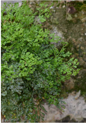
Aspleniaceae Asplenium ruta-muraria Mauerraute