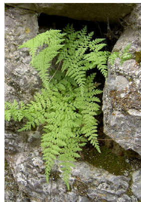
Woodsiaceae Cystopteris fragilis Gewöhnlicher Blasenfarn