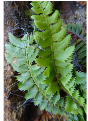
Dryopteridaceae Polystichum lonchitis Lanzenfarn