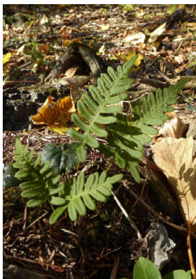
Polypodiaceae Polypodium vulgare Tüpfelfarn