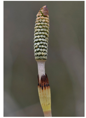
Equisetaceae Equisetum telmateia Riesenschachtelhalm