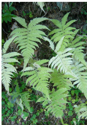
Thelypteridaceae Phegopteris connectilis Buchenfarn