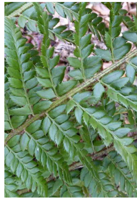
Dryopteridaceae Polystichum aculeatum Gelappter Schildfarn