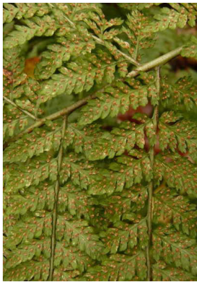
Dryopteridaceae Dryopteris dilatata Breiter Wurmfarne