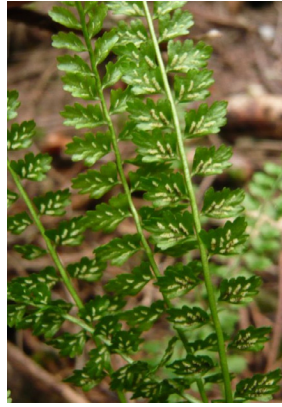
Aspleniaceae Asplenium viride Grünstielliger Streifenfarn